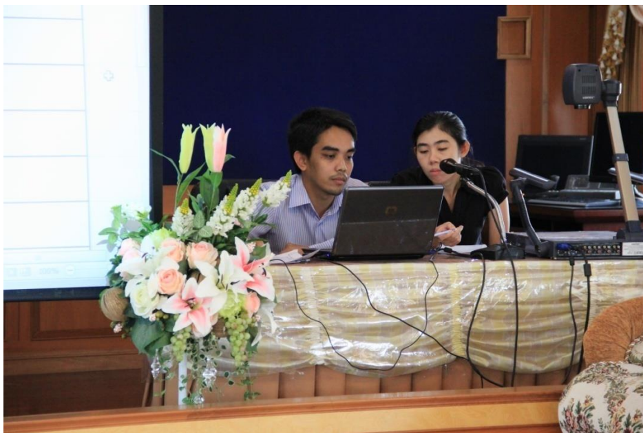
ภาพที่ 2 ลงข้อมูลสำหรับจัดสรรงบประมาณ