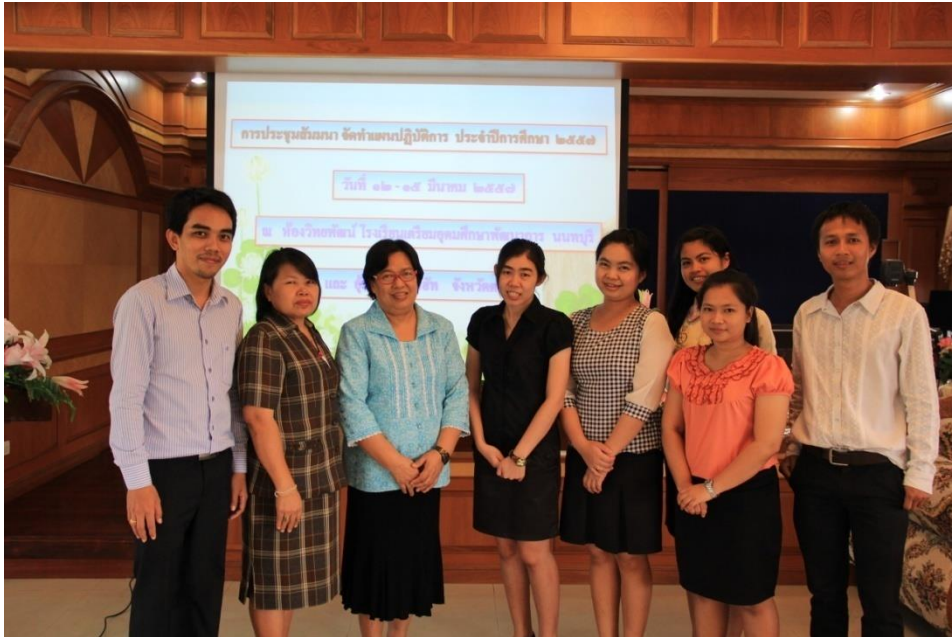
ภาพที่ 1 คณะกรรมการการดำเนินงาน